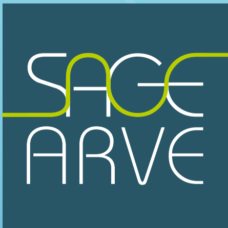
SCHÉMA D'AMÉNAGEMENT ET DE GESTION DES EAUX DE L'ARVE